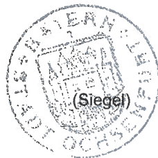
P. Juks 1. Bürgermeister

Angeschlagen am: 08.10.2021 Abgenommen am: 22.11.2021 Bekanntmachung Homepage am: 08.10.2021 Von Homepage genommen am: