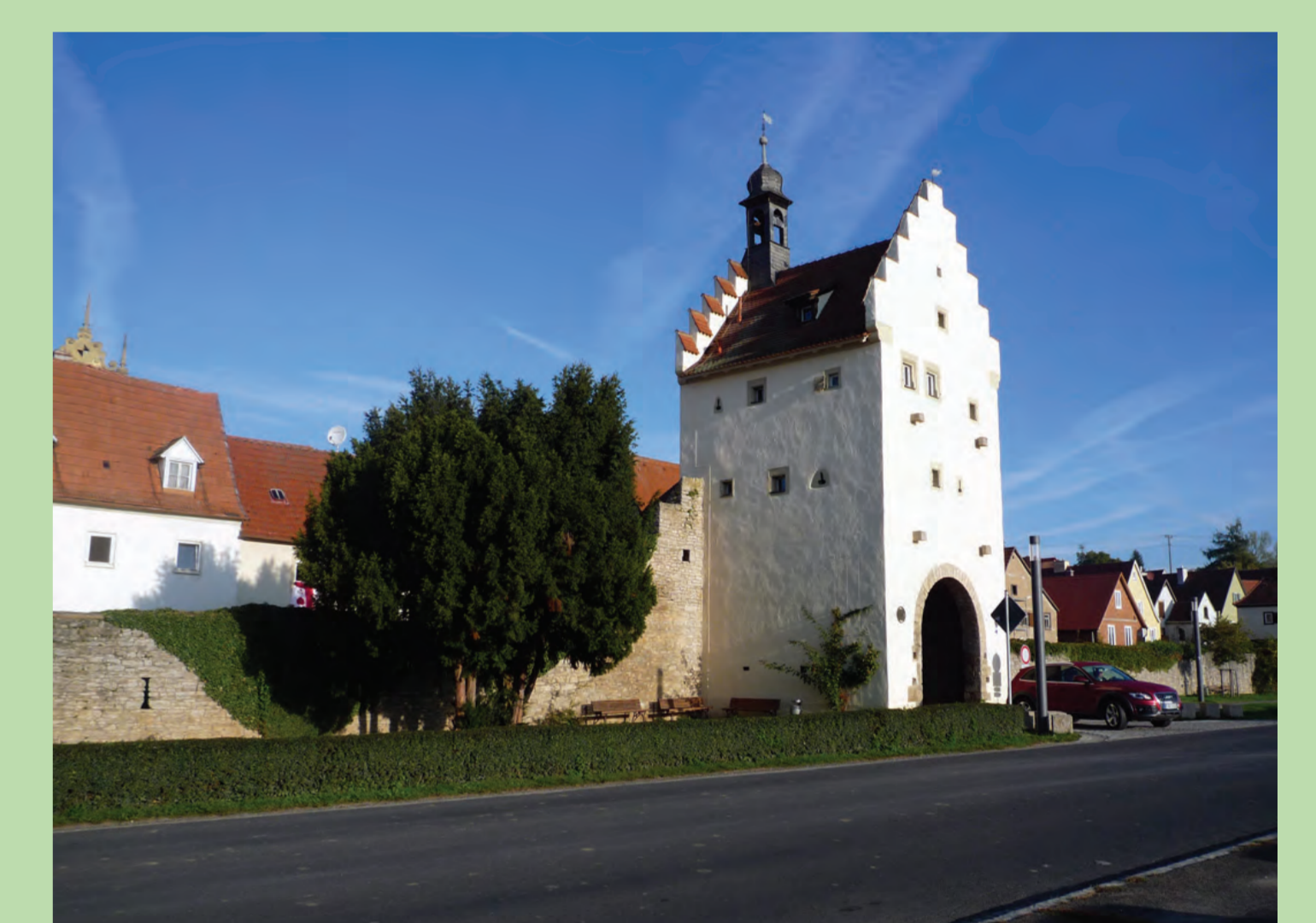
Sulzfeld am Main